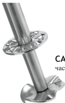
CAC112 Мешалка для твердых частиц (6шт)