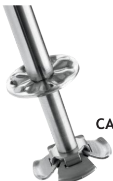
CAC123 Мешалка-бабочка (6шт)