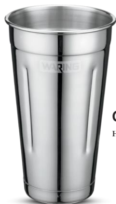
CAC20 Стакан из нержавеющей стали