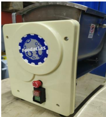
Рис 5 Панель управления. Электромагнитная комплексная кнопка Пуст/Стоп, Аварийный стоп.