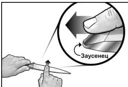
Рисунок 5. Добейтесь образования заметного заусенца вдоль всей кромки лезвия, перед тем как переходить к полировке в Устройстве 2. Чтобы обнаружить заусенец, проведите пальцем поперек кромки лезвия. Осторожно! См. инструкцию.