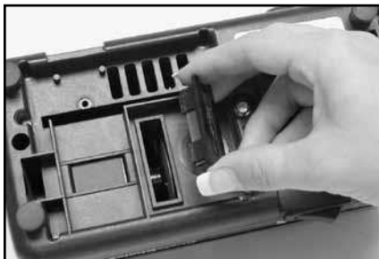
Рисунок 10. Крышка очистительного устройства на нижней панели точилки.

Раз в год или по мере необходимости удаляйте металлическую пыль, скопившуюся внутри точилки в результате многократной заточки. Снимите маленькую прямоугольную крышку очистительного устройства (Рис. 10), которая находится на нижней панели точилки. Вы обнаружите металлические частицы, скопившиеся на магните, встроенном во внутреннюю сторону этой крышки. Просто сотрите или стряхните скопившиеся частицы с магнита бумажным полотенцем или зубной щеткой и установите крышку на место. Если в точилке скопилось слишком много металлической пыли, снимите крышку и вытряхните пыль через нижнее отверстие. После очистки установите крышку с магнитом на место.