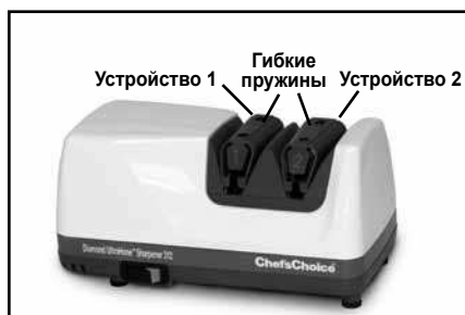
Рисунок 1. Точилка Diamond Hone® Модели 312.

Рисунок 1 показывает каждое из двух устройств (вид снизу), каждое из них детально описано в следующих разделах.