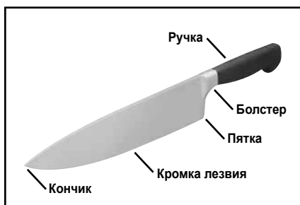
Рисунок 2. Обычный кухонный нож.