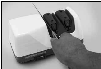
Рисунок 3. Устройство 1. Лезвие в пазу между угловой направляющей и эластичной пружиной. Чередуйте проходы в левом и правом пазах Устройства.

Устройство 1: Если вы затачиваете нож с гладким лезвием впервые, начните с Устройства 1. Протяните нож один раз через левый паз Устройства 1 (Рисунок 3). Лезвие должно скользить между левой пластиковой угловой направляющей и пластиковой пружиной. Вы должны тянуть за ручку ножа на себя, при этом нужно слегка надавливать вниз, для того, чтобы лезвие вошло в контакт с абразивным диском. Когда лезвие войдет в контакт с диском, вы услышите характерный звук. Если лезвие имеет кривую форму и загибается вверх ближе к концу, то, по мере приближения к концу, нужно слегка приподнимать ручку, сохраняя при этом слышимый контакт между лезвием и вращающимся абразивным диском. Заточите лезвие по всей длине. Для 20-сантиметрового лезвия каждый проход должен длиться примерно 6 секунд. Для более коротких лезвий - 3-4 секунды.