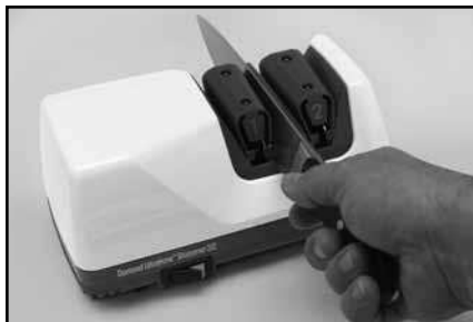
Рисунок 4. Лезвие в правом пазу Устройства 1.

Если заусенца нет, сделайте одну или две пары дополнительных попеременных проходов в левом и правом пазах Устройства 1, прежде чем продолжить заточку в Устройстве 2. Если вы будете проводить лезвие медленнее, это поможет вам получить заусенец. Убедитесь в наличии заусенца после прохода в левом пазу, а затем также после прохода в правом пазу, прежде чем продолжать заточку на Устройстве 2.