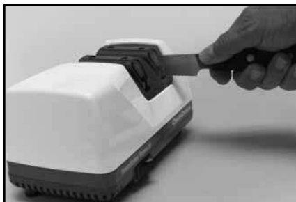
Рисунок 9. Зубчатые лезвия затачиваются только в Устройстве 2. (См. инструкции.)

Повторная заточка зубчатых ножей производится так, как описано в предыдущем разделе.