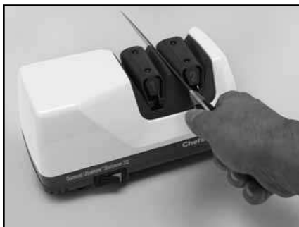
Рисунок 6. Лезвие в левом пазу Устройства 2. Чередуйте проходы в левом и правом пазах Устройства.

Для резки волокнистых материалов, таких как лайм, лимон и мясо, возможно лучше подойдет следующая процедура заточки: заточите нож в Устройстве 1 до образования заусенца по всей длине лезвия, а потом сделайте только два или три попеременных быстрых прохода в Устройстве 2. Это оставит заточенные микроканавки на кромке лезвия (Рисунок 8), которые помогут резать волокнистые продукты.